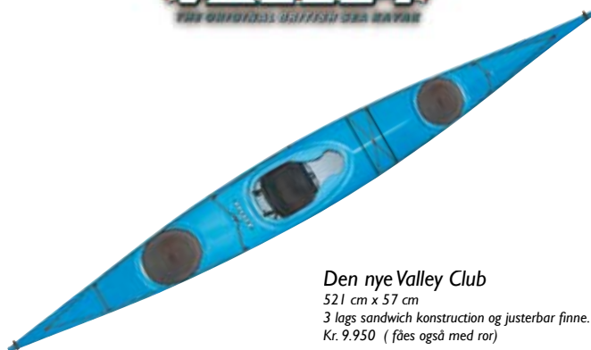
Den nye Valley Club 521 cm x 57 cm 3 lags sandwich konstruktion og justerbar finne. Kr. 9.950 ( fåes også med ror)